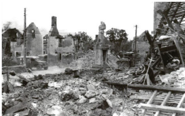
Cimetière civil de La Chapelle-Enjuger.

Du côté civil, on dénombrera 9 morts à La Chapelle-Enjuger, 3 à Hébécrevon : la majeure partie des habitants avaient fui pendant l'exode.