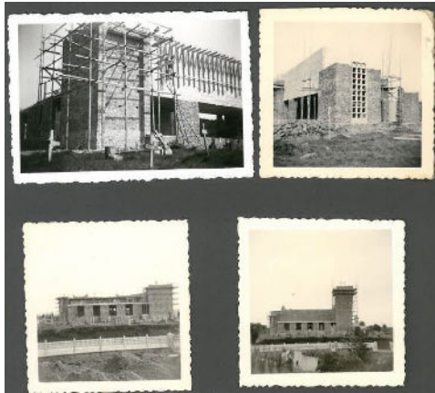
L'église d'Hébécrevon, lors de sa reconstruction.

En 1947, le préfet de La Manche posait la première pierre de la Reconstruction. Celle-ci devait se faire lentement puisque cinq ans plus tard, des habitants vivaient encore dans des baraques en bois. Peu à peu, les maisons s'élevèrent et la reconstruction s'acheva par celle de l'église en 1960.