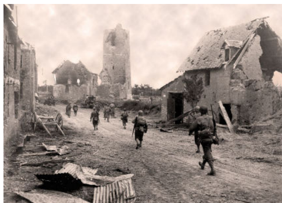
Soldats américains dans les rues d'Hébécrevon.

Point névralgique de cet assaut, La Chapelle-Enjuger est entièrement détruite ; mais la percée américaine est réussie : le 25 août 1944, Paris est libérée, Bruxelles le sera dix jours plus tard. Aix-La-Chapelle est la première commune allemande à être libérée, le 21 octobre.