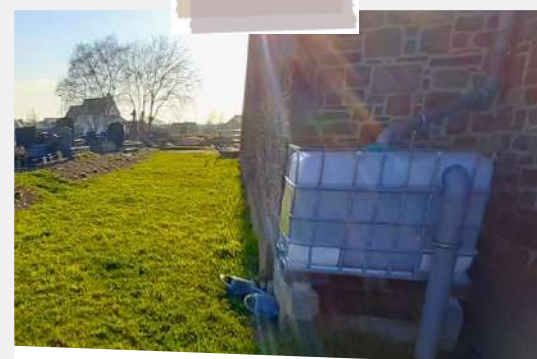
Cimetière d'Hébécrevon : création de massifs et mise en place d'un récupérateur d'eau