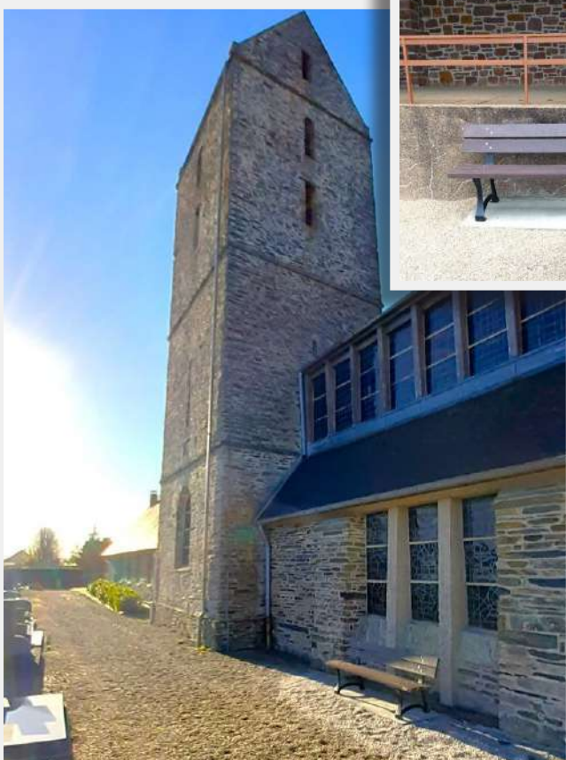
Mise en place de bancs autour des églises