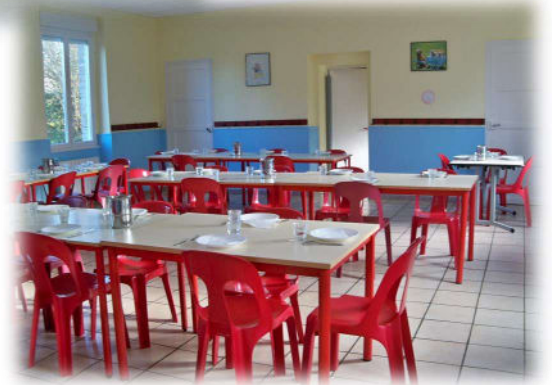
A La Chapelle Enjugar, chaque groupe a sa salle de restauration.