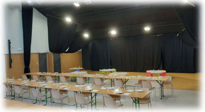
A Hébécrevon, la salle culturelle est transformée en salle de restauration.